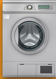
SECADORAS DE ROPA